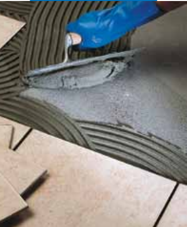
Egyszer égetett burkolólap ragasztása padlóra