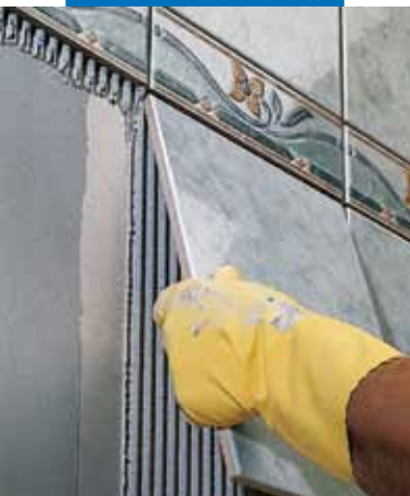
Egyszer égetett burkolólap ragasztása vakolatra