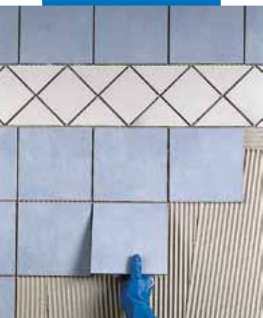
Egyszer égetett burkolólap ragasztása gipszkarton falra